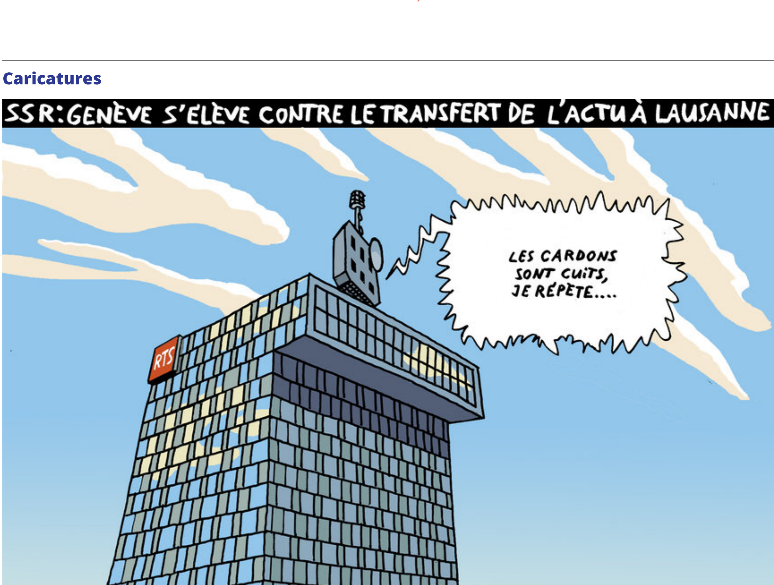
SSR: Genève s'élève contre le transfert de l'actu à Lausanne